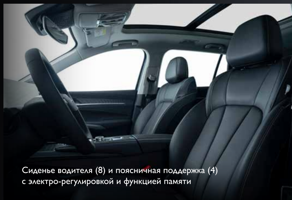
Сиденье водителя (8) и поясничная поддержка (4) с электро-регулировкой и функцией памяти