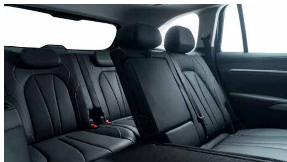
Количество мест 7