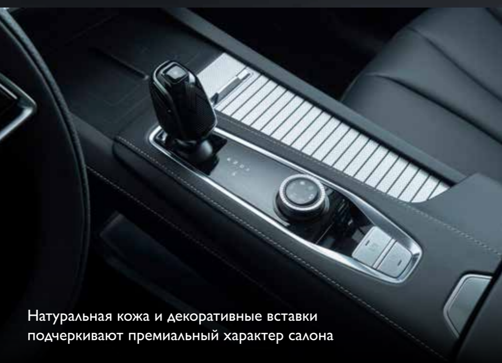
Натуральная кожа и декоративные вставки подчеркивают премиальный характер салона