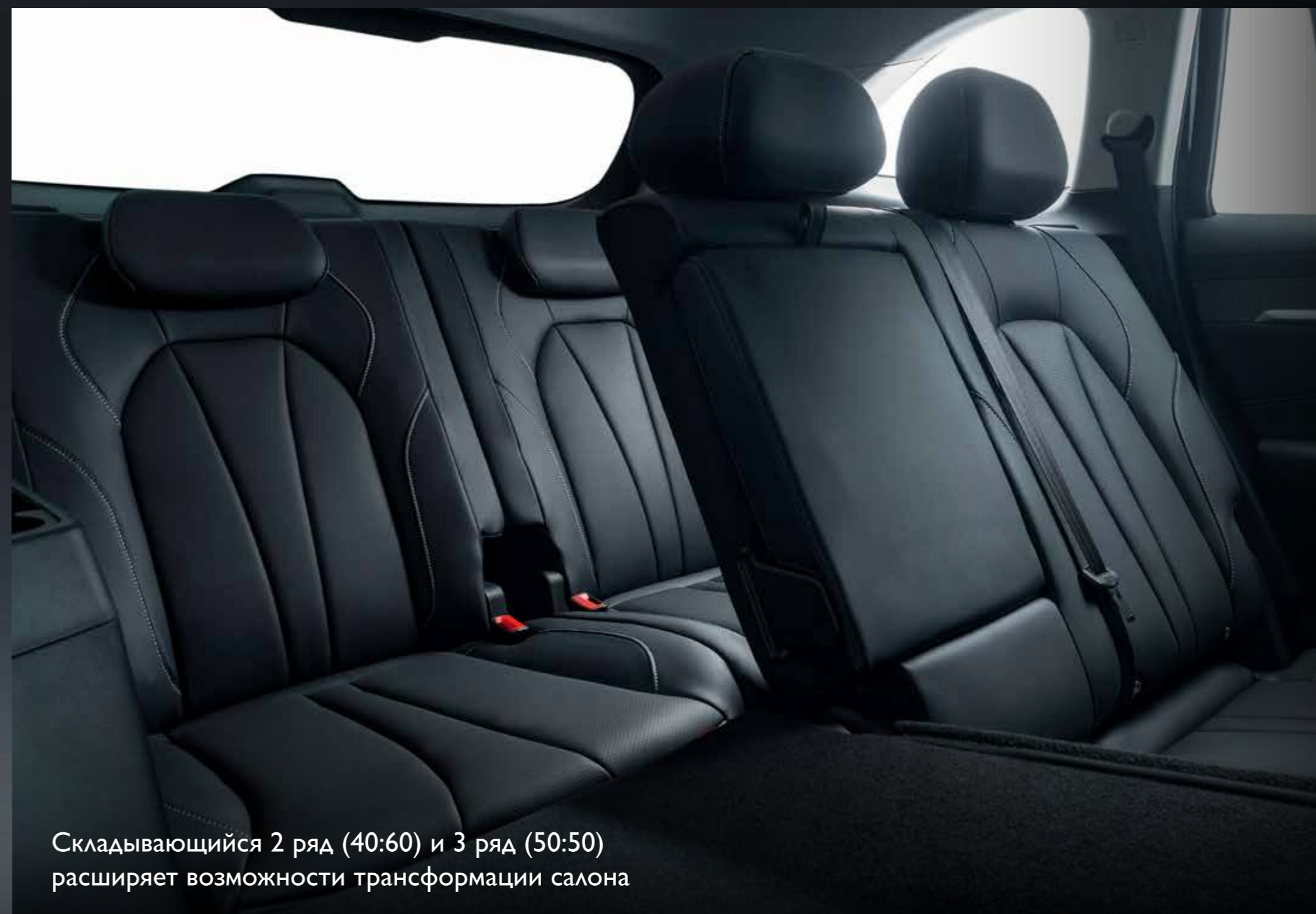
Складывающийся 2 ряд (40:60) и 3 ряд (50:50) расширяет возможности трансформации салона