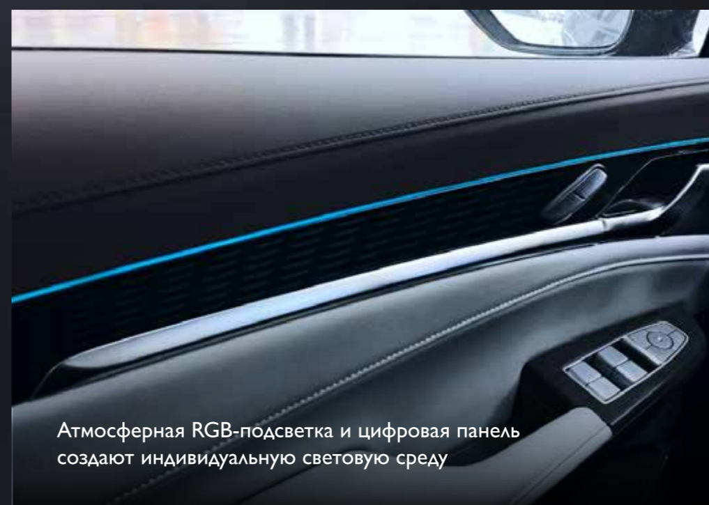
Атмосферная RGB-подсветка и цифровая панель создают индивидуальную световую среду