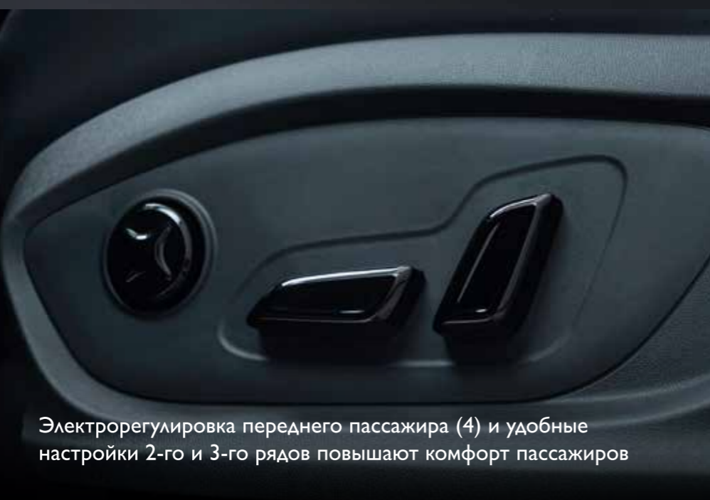
Электрорегулировка переднего пассажира (4) и удобные настройки 2-го и 3-го рядов повышают комфорт пассажиров