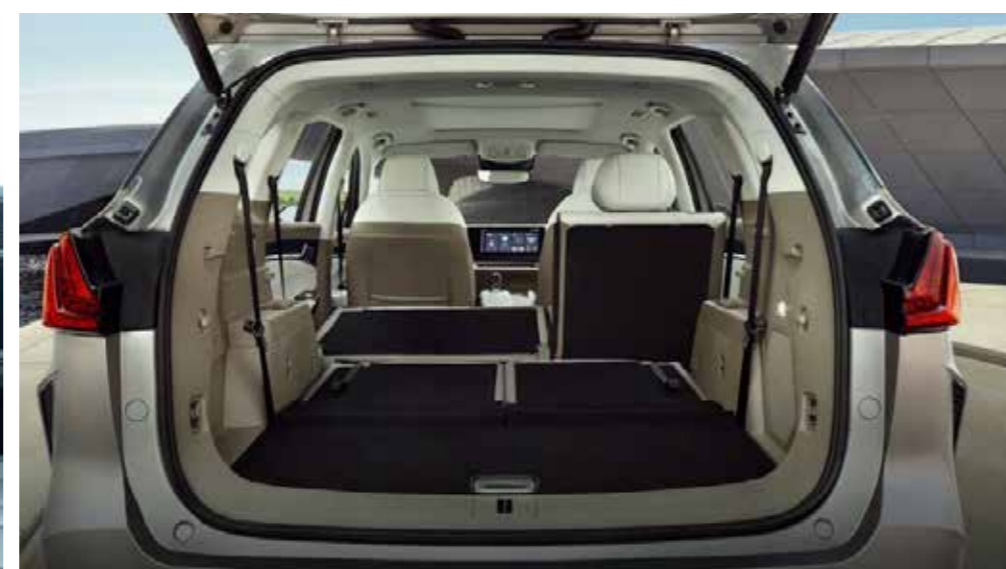
Объем багажного отделения 203 / 517 / 1052