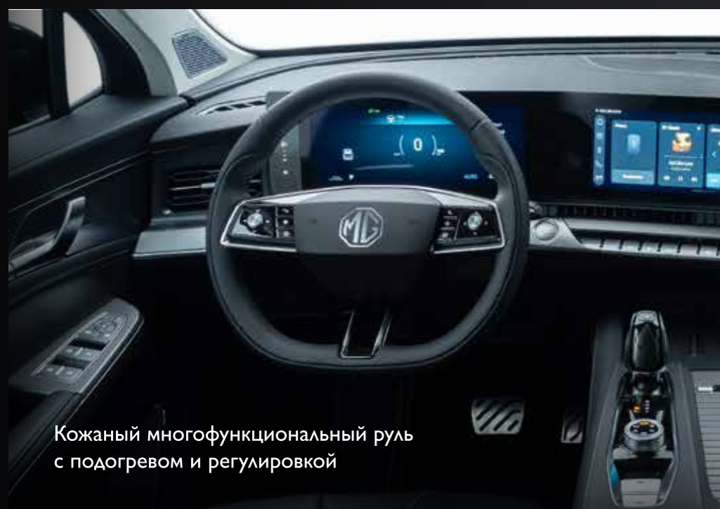
Кожаный многофункциональный руль с подогревом и регулировкой

Натуральные материалы, интеллектуальные системы и продуманная эргономика создают атмосферу уверенного спокойствия и современного люкса.