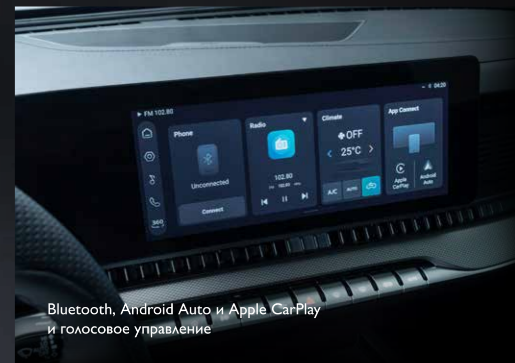
Bluetooth, Android Auto и Apple CarPlay и голосовое управление