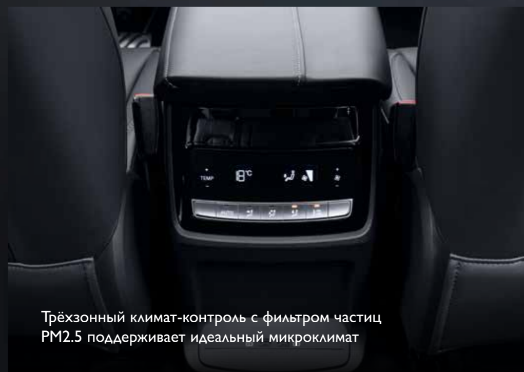
Трёхзонный климат-контроль с фильтром частиц PM2.5 поддерживает идеальный микроклимат